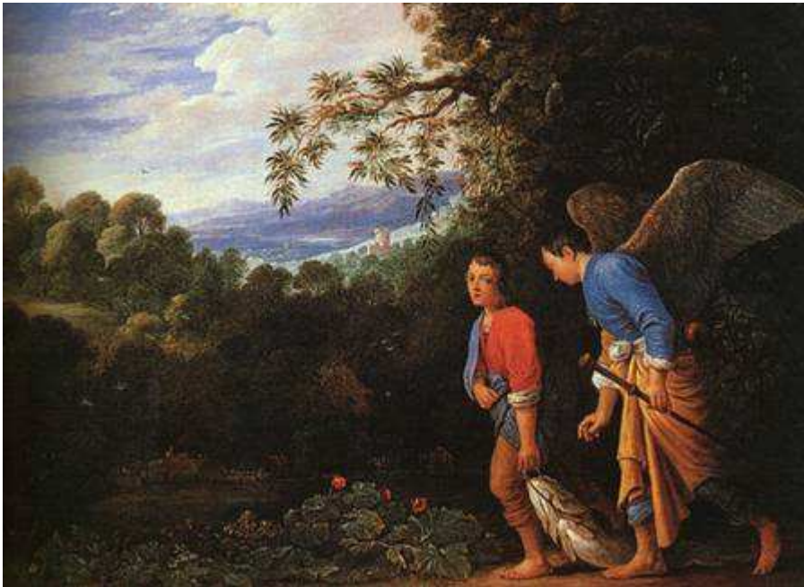
Tobie et l'Ange - Copie par les disciples d'Adam Esheilmer, 1625 Site chretiensaujourd'hui.com