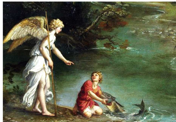
Le Dominiquin – L'archange Raphaël avec Tobie – Extrait - vers 1610-13

Cahier Evangile 101, Le livre de Tobit ou le secret du Roi, p.38