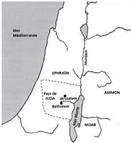
Une femme étrangère, Collection Dieu dans nos vies, Olivetan, p. 14.