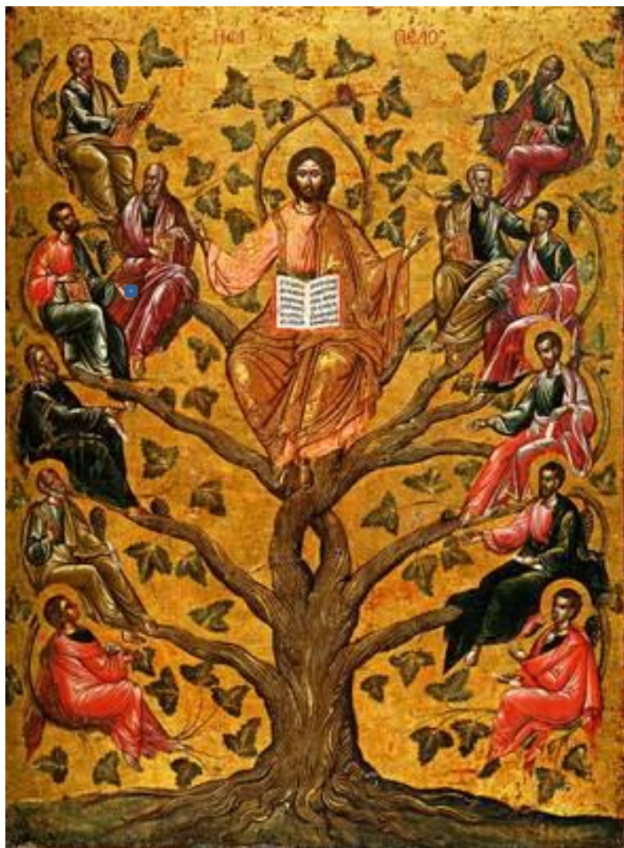
Christ vrai cep, XVIe siècle, icône grecque

« Moi, je suis la vigne, et vous, les sarments.