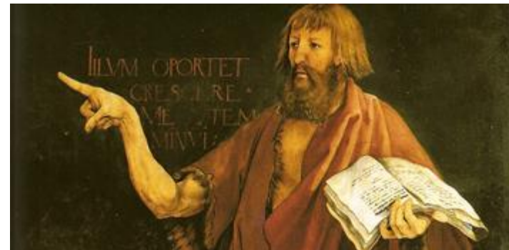
Jean-Baptiste dans « La Crucifixion » détail du retable d'Issenheim de Matthias Grünewald (1512-1516) Musée d'Unterlinden à Colmar.

Que dit-on de Jésus ? En quoi cela nous concerne-t-il ?