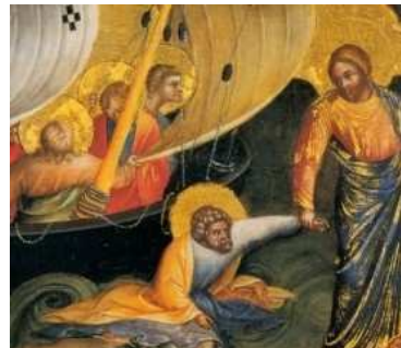
Laurenzo Veneziano, 1370