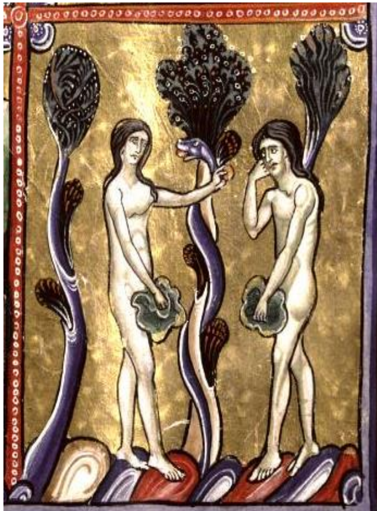
Bible de Souvigny, fin du X ème siècle

Leurs yeux à tous deux s'ouvrirent et ils surent qu'ils étaient nus.