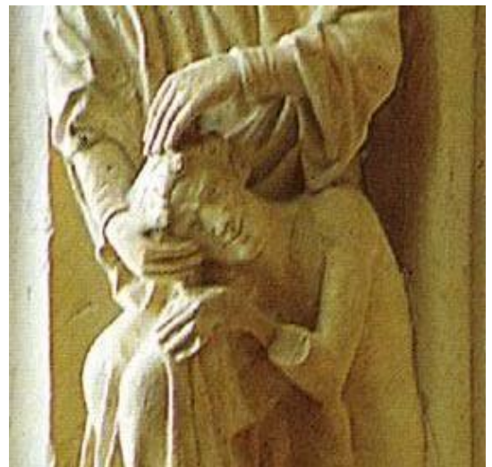
Chartres, La création de l'homme

Dans ce vis-à-vis, l'humanité advient dans la prise de parole : l'homme reconnaît son véritable vis-à-vis, celle qui est issue de sa chair, l'autre qui à la fois lui ressemble et lui est dissemblable.