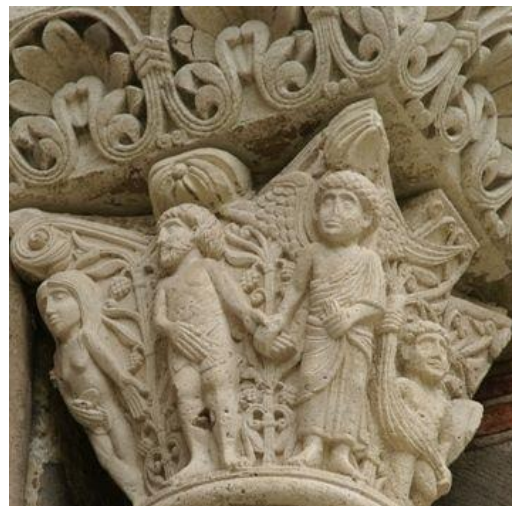
Adam et Eve chassés du Paradis Porte Miègeville basilique Saint Sermin, Toulouse

Pape François, La joie de l'amour , n°12