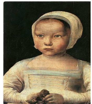
La fillette à l'oiseau mort, XVIème

F.Carillo, Vers l'inépuisable Labor et Fides p.35