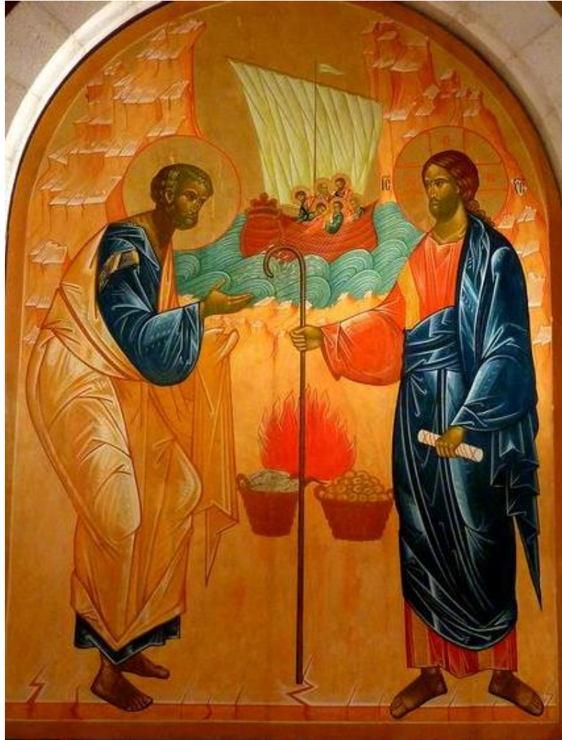
Eglise Saint Pierre en Gallicante, Jérusalem