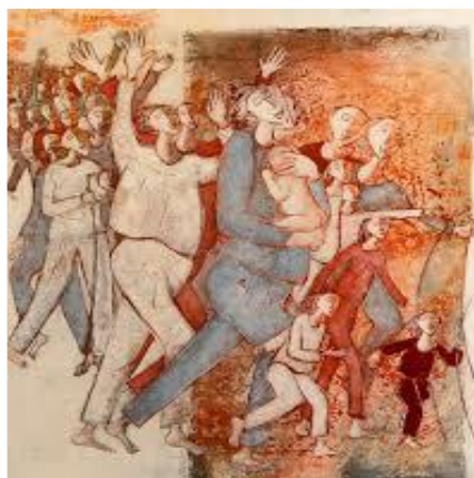
Affiche du Synode Lille-Arras-Cambrai www.synodelac.fr

Deux lettres du Nouveau Testament lui sont attribuées.