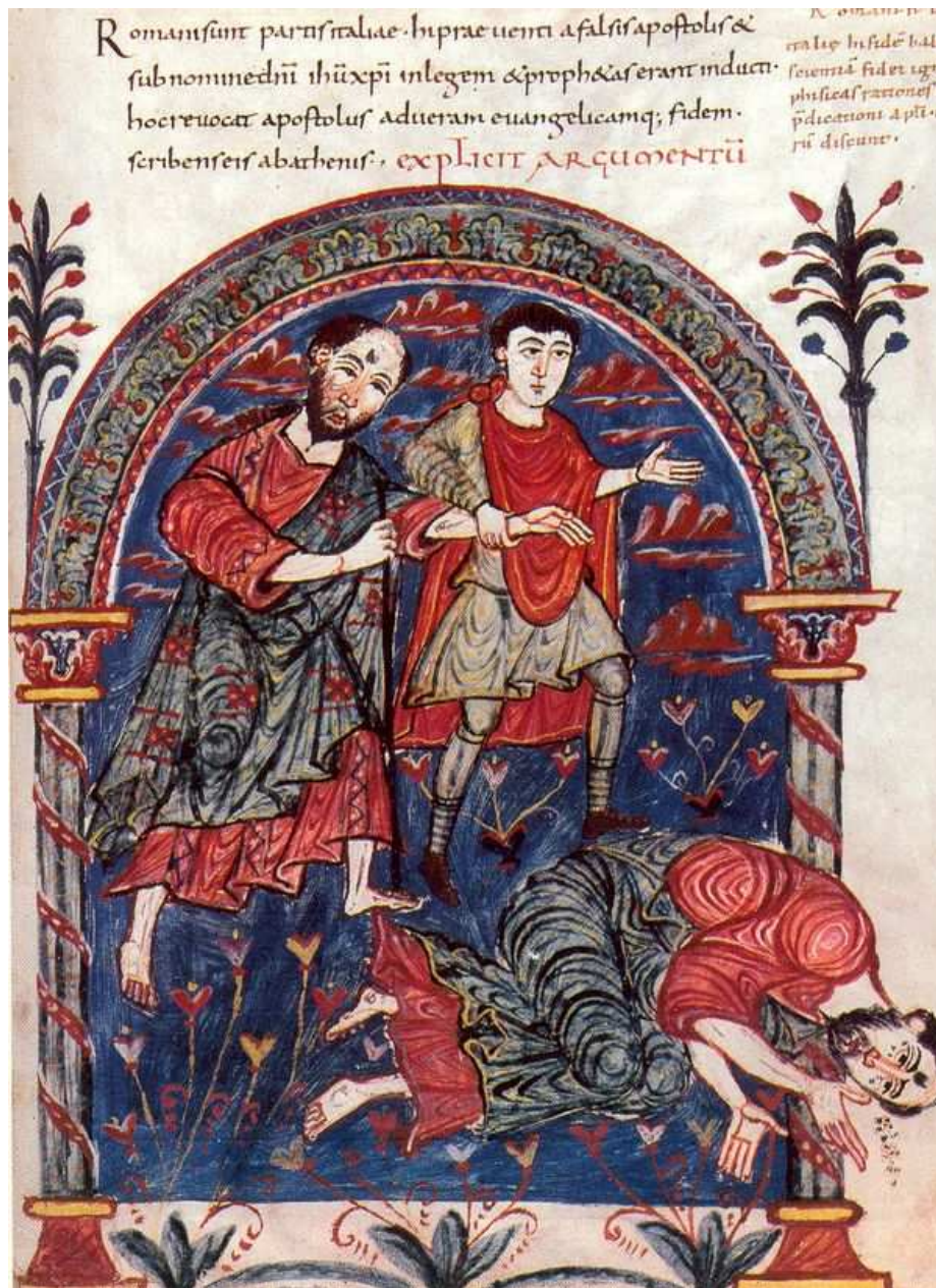
Manuscrit carolingien IXème siècle

« Tombant à terre, il entendit une voix qui lui disait : « Saoul, Saoul, pourquoi me persécuter ... »