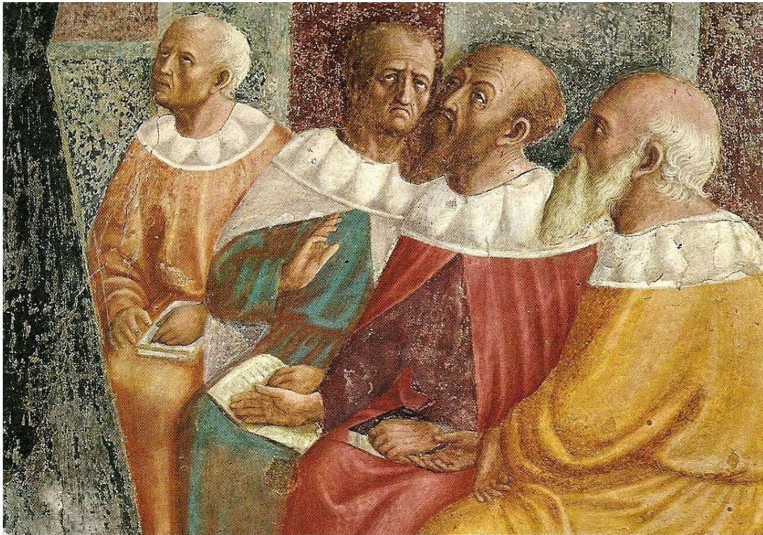
Les Philosophes d'Alexandrie (détail)

Basilique St Clément de Rome, Chapelle Ste Catherine Masolino da Panicale, 1425