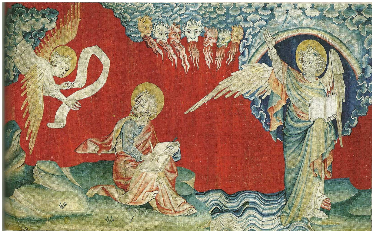
L'Ange au livre ouvert, détail de l'Apocalypse d'Angers

« Et la voix que j'avais entendue venant du ciel me parla de nouveau et dit : Va, prends le livre ouvert dans la main de l'ange qui se tient debout sur la mer et sur la terre » Ap 10,8